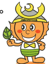
法人イメージキャラクター げんきくん